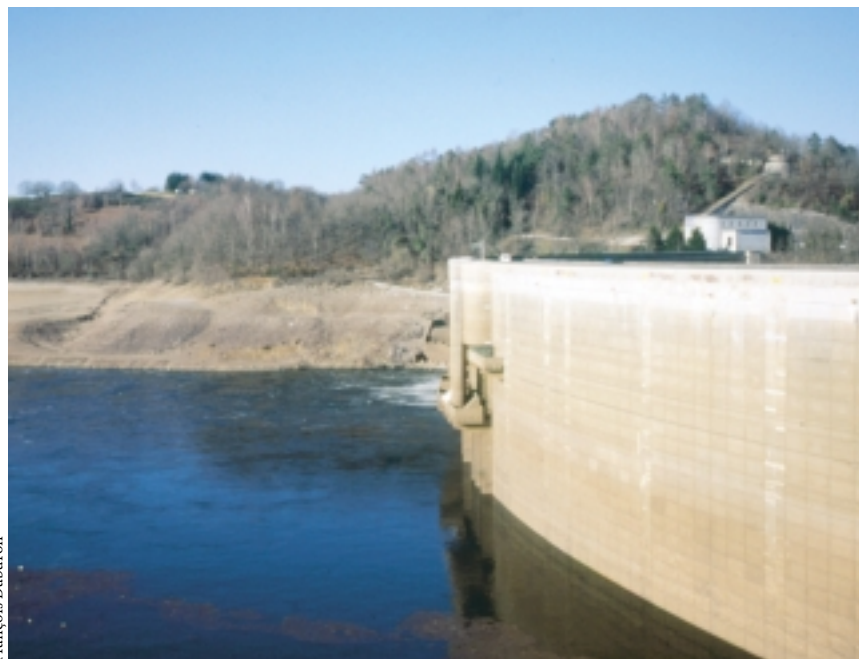
Le barrage de Bort-les-Orgues, une des pièces maîtresses de la production hydraulique régionale d'électricité.

L'électricité produite par EDF en Limousin est exclusivement d'origine hydraulique. Les barrages de Bort-les-Orgues, L'Aigle, Chastang et Vassivière, avec le support de la vingtaine d'autres installations plus modestes, fournissent les deux tiers des besoins de la région.