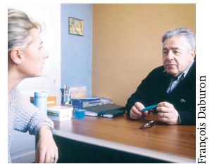
L'offre Dialège: des services spécifiques pour les communes.